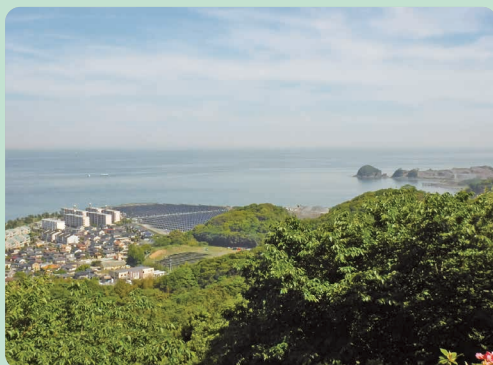
周防灘と蕪島(山頂広場より)

企救半島の東側に白野江植物公園がある。傾斜がある公園なので白野江の丘と呼ぶことにする。四季折々の植物が楽しめる。山頂からの眺めもよい。 JR「門司港」駅から西鉄バスに乗車し「白野江」丁目バス停で下車。終始、舗装道を歩く。公園への誘導標識に従い進み、入場口で入園料を払って中に入る。 交点①は中央の道を上る。山頂広場まで坂と平坦な道を繰り返す。