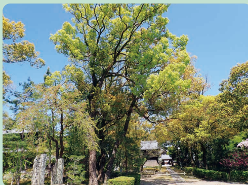
御供所特別緑地（聖福寺）

喧騒な博多駅近くに心安らぐ特別緑地（特別緑地保全地区）が4か所ある。すべて社寺がそれにあたり、どれも駅の博多口から15分ほどで訪れることができる。まずは博多駅前特別緑地（A…承天寺）。博多千年門から始まる承天寺通りの間にある。寺本殿の前には大きなクスノキが立つ。次に御供所特別緑地（B…聖福寺）。アカマツ、クロマツ、カエデ、とくにクスノキが目立つ。寺の境内は広く散策することがで