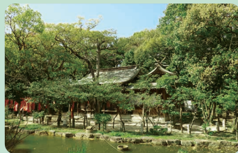
住吉特別緑地(住吉神社)