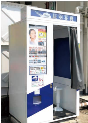
証明写真機(コンビニの駐車場や商業施設に設置している)

①市区町村に問い合わせ申請書をお願い提出する。(福岡市はマイナンバーカード総合窓口が各区役所に設置されています)