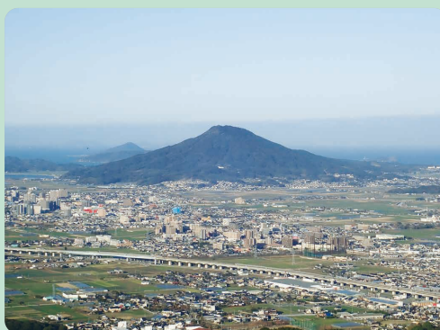
可也山(鐘撞山より)

糸島半島の中央に座す可也山。別名「糸島富士」と呼ばれる。JR筑肥線「筑前前原」駅から糸島市コミュニティバスを利用して訪れる。 「師吉公民館」バス停で下車。トイレ、駐車場もあるが満車のことが多い。雲泉寺を過ぎ「遊歩道入口」の標識がある分岐①は右へ。坂を上り分岐②を左へ行くとバス停から10分くらいで「登山口」に着く。 きつい上り坂になると、まも