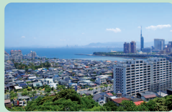
室見川河口方面(愛宕山より)

場 所 福岡市西区 一口メモ 元旦は初詣やご来光で賑わう。桜、紅葉の名所で福岡市街の夜景もきれいに見える。