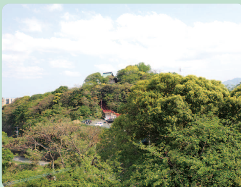
愛宕山(愛宕山緑地の頂上)

愛宕山(68m)の山頂に愛宕神社がある。この一帯は特別緑地保全地区のため自然とも触れ合える。地下鉄「室見」駅から周回する。 室見橋を渡り西へ。愛宕西一交差点先の分岐を右へ行くと15分程で鳥居が立つ分岐①に着く。 右へ入りヤブツバキ、シイノキなど見ながら階段を上る。観音寺を過ぎ、石段を上り詰め左へ。分岐②の階段を上ると展望