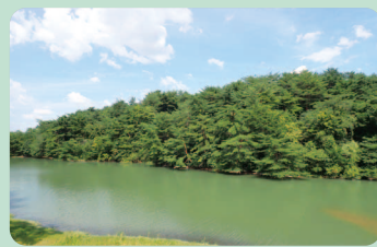
中の島の見事なアカマツ林

場所 春日市 一口メモ 中の島の中には入れない。ちびっこ広場には、いろいろな種類の遊具が設置されている。