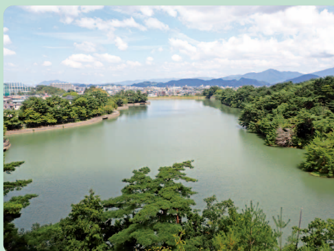
白水池と右に中の島(展望台より)

筑前三大池のひとつである白水池。池の周りを自然とふれあいながら歩く。 西鉄天神大牟田線「大橋」駅から西鉄バスに乗り「松ヶ丘入口」で下車。マイカーのときはP①に駐車する。公園入口の分岐①から管理棟をめざす。桜、つつじなど植えてある。平成橋、小西橋を渡り分岐②、分岐③へ進む。この付近、とくに中の島のアカマツ林が素晴らしい。やがてバス停から20分程で展望台に着く。