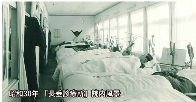
昭和30年「長垂診療所」院内風景