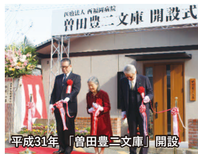
平成31年「曾田豊三文庫」開設