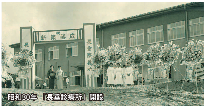
昭和30年「長垂診療所」開設