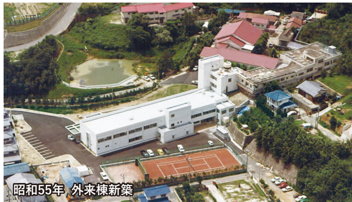
昭和55年 外来棟新築