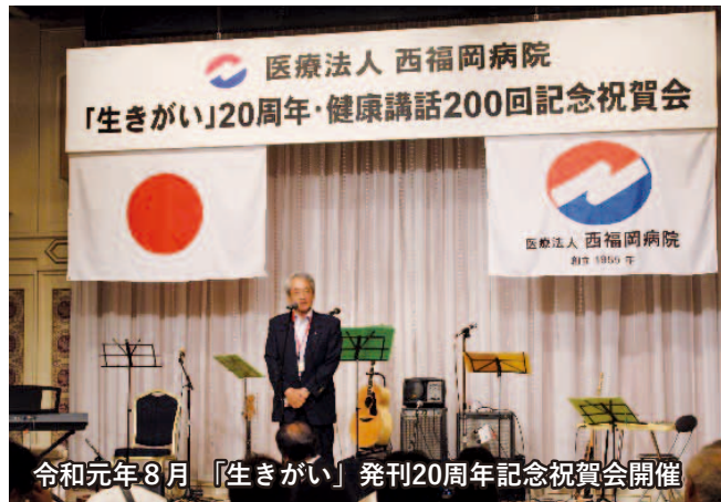
令和元年8月「生きがい」発刊20周年記念祝賀会開催