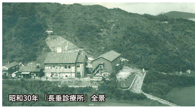
昭和30年「長垂診療所」全景