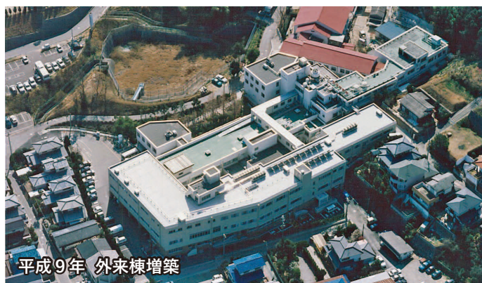
平成9年 外来棟増築