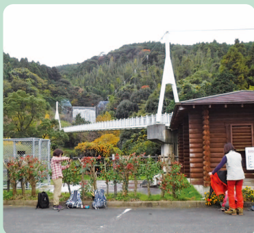
加茂ゆらりんこ橋(駐車場から)

駐車場から歩き始めて20分程経つと、清々しい溪流を觀賞できる所(★景観適地)に着く。ベンチもあり、くつろげる。 加茂ゆらりんこ橋の上からの見晴らしもよい。南側の眼下には木々と溪流の流れが。北側には糸島半島の可也山 かやさん など眺めることができる。 場所 糸島市二丈福井 にしじょうふくい 一ロメ ハイキングがてらに歩くのであれば、JR大入駅 おおい から歩くのもよいだろう。加茂ゆらりんこ橋まで約3.5km。