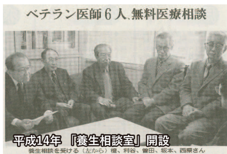
ベテラン医師6人、無料医療相談