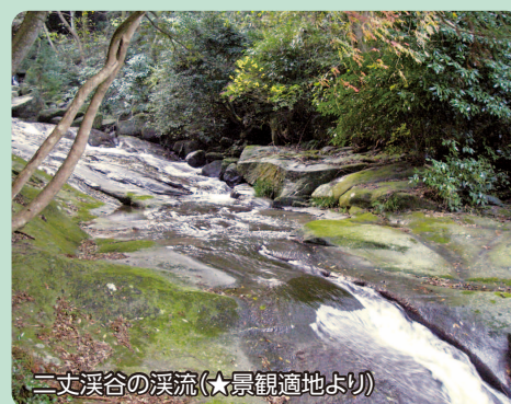
二丈溪谷の溪流(★景観道地より)

JR筑前深江駅から車で国道202号線を西へ。二丈溪谷への誘導標識がある分岐を左折する。舗装道を上り、加茂川砂防緑地にある加茂ゆらりんこ橋の駐車場に止める。駅から10分程。ここで標高は約130m。行楽客や登山者の姿も見かける。 橋を渡り、二丈溪谷を流れる加茂川に沿って山道を上る。溪谷は深くなく、近づきやすい雰囲気がある。晩秋から初春にかけ、植物の赤や白の実が林内に色を添える。