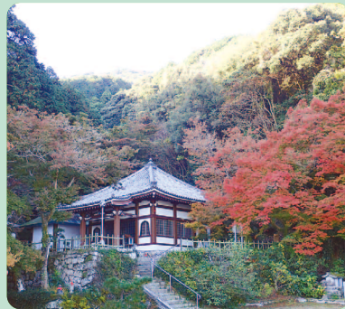
観音堂周辺の木立

石畳を上る。秋から冬にかけ野草の花や実が境内を彩る。新羅式石門をくぐると上り口から数分で観音堂に着く。まわりには油山十八景の起源となった、十八羅漢石像が点在する。近くの観月楼展望台から、福岡市街と周辺の島や連山が一望できる。晩秋訪れると境内の力エデなどの紅葉がきれいだ。 場所 福岡市城南区東油山 アクセス 油山観音から800m 程先に片江展望台がある。