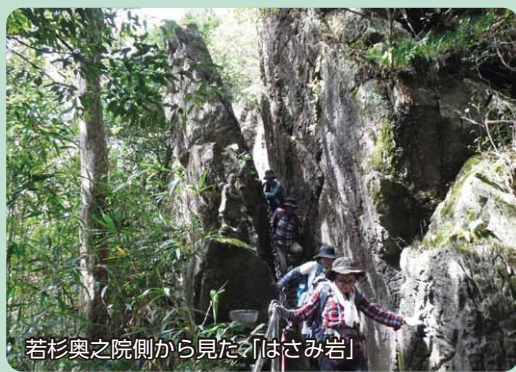
若杉奥之院側から見た「はさみ岩」

篠栗駅から若杉山、米ノ山展望台方面に9km程車を走らせると、若杉奥之院の駐車場(標高約530m)に着く。若杉観音堂、トイレもある。杉林の山道を30分程上ると、太祖神社上宮の裏手に着く。休憩所があり、福岡県指定天然記念物の大杉も出てきてくれる。岩の道を下りはじめると、ほどなく「はさみ岩」が現れる。弘法大師が杖で割って通路を開いたなどの逸話があり、「はさみ岩」は善人しか通れない