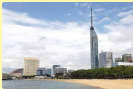
▲室見川河口から眺める福岡タワー方面の景色

範囲 福岡市西区・早良区 歩行距離 8・2 km 高低差 60 m 歩行時間 125分 一〇メモ 歩く途中、興味や関心 がある場所で、のんびりくつろぐ のもよいだろう。