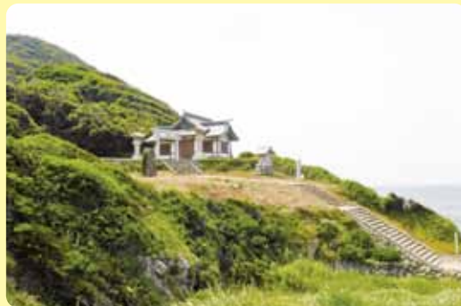
▲沖ノ島が望める沖津宮選拝所

選拝所からおよそ30分で大島港に帰り着く。 範囲 宗像市 歩行距離 9.3km 高低差 210m 歩行時間 185分 一〇メモ 大島港の近くの飲食店で、海の幸を味わうこともできる。