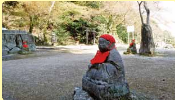
▲油山観音の境内にある十六羅漢石像

ある。夫婦岩からおよそ55分。 範囲 福岡市城南区・南区 歩行距離 7・4km 高低差 260m 歩行時間 140分 一〇メモ 花畑園芸公園では四季 折々の植物が鑑賞できる。入園は 無料。