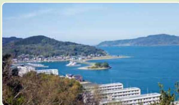
▲左：毘沙門山／右：能古島（東展望所より）

き返す。東展望所から約30分。 範囲 福岡市西区横浜 歩行距離 3・5km 歩行時間 60分 一ロメモ 落葉する季節であれば、西展望所からも木の間を通して可也山、糸島平野などが望める。