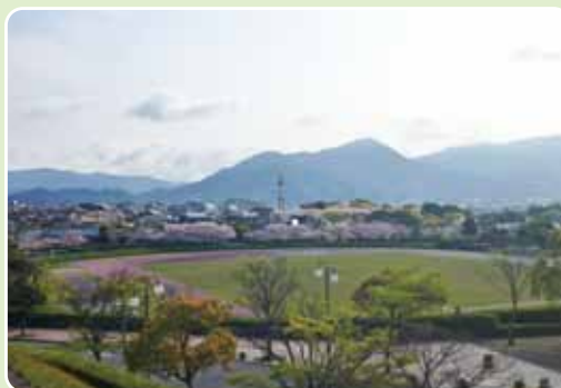
▲見晴しの丘から眺める景色