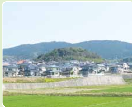
▲広陵台のほぼ中央に座す高田山

が目を引く。分岐④から階段を下り右へ行くと、頂上から10分位でバス停に戻る。 範囲 宗像市広陵台 歩行距離 2・5 km 歩行時間 40分 一〇メモ マイカーのときは、無料駐車場(①)に止めるとよい。バス停そばの赤木の里で生鮮食料品が販売されている。