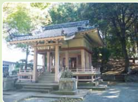
▲諸岡八幡宮（この裏の小高い古墳が頂上）

着く。諸岡池には小さな子どもが水遊びできる広場もある。 範囲 福岡市博多区諸岡 歩行距離 3・0 km 歩行時間 50分 一〇メモ バス利用でも訪れることができる。笹原駅近くに有料駐車場もある。