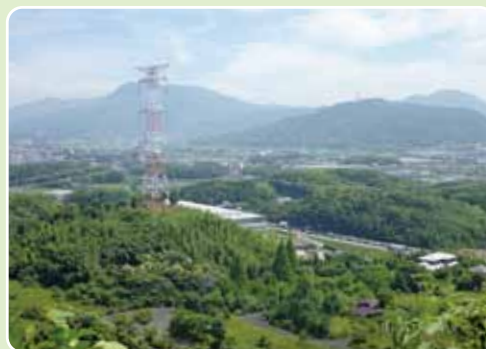
▲宮地嶽頂上から三郡山地方を望む

範 囲 筑紫野市原田 歩行距離 4・9 km 歩行時間 90分 一口メモ 五郎山古墳館、筑紫神社、アルカリ天然水のパルクの湯に立ち寄れる。