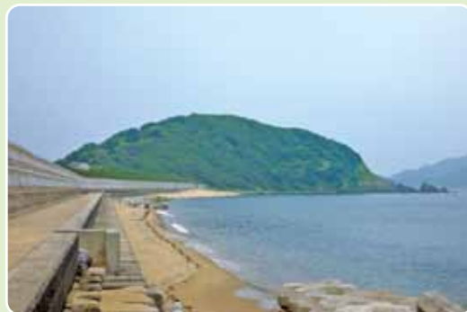
▲佐屋形山を深浜海水浴場から眺める

宗像市鐘崎 歩行距離 5・1 km 歩行時間 90分 一ロメモ 海産物販売所や国民宿舎「びびき」にレストランもある。