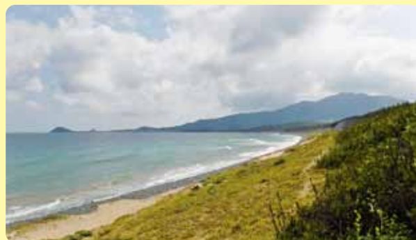
▲さつき松原と左奥に鐘崎の佐屋形山を望む

よいだらう。 範囲 宗像市 歩行距離 8・4 km 高低差 40 m 歩行時間 125分 一口メモ 道の駅むなかたは、歩く途中にあるので気軽に立ち寄れる。