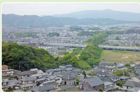
▲遠くに脊振山、眼下に水城跡(国分高台より)

範囲 太宰府市国分 歩行距離 4・4 km 歩行時間 85分 一〇メモ 都府楼前駅から片道徒歩15分程で、大宰府政庁跡と太宰府展示館にも立ち寄れる。