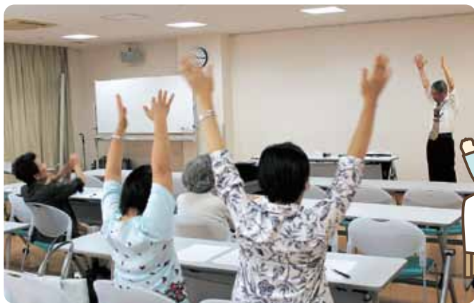
8月23日の健康講話の一幕。健康講話に来られた方と一緒にラジオ体操をしました。